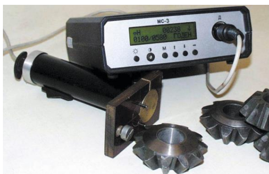
Рисунок 1 – Прибор «Магнитный сортировщик МС»

Неразрушающий анализ структуры крупногабаритных стальных изделий и чугунных отливок основан на локальном измерении их коэрцитивной силы [1]. Одним из методов намагничивания изделий для этого является метод «точечного полюса» [2] и реализующие его приборы [2 – 4], например, «Магнитный сортировщик МС» (рис. 1).